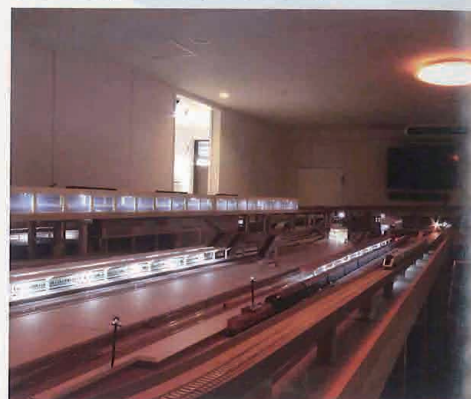
▲室内の照明はカラーLEDを採用しているので、夕暮れの雰囲気やトワイライトタイムの雰囲気など光の演出も可能。