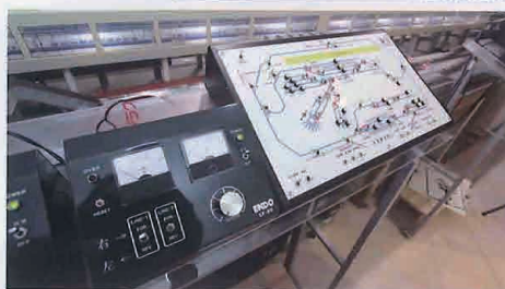
▲エンドウのパワーバックとポイント操作・通電状況確認を司る運転盤。