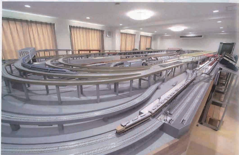
▲全6線が複雑に走るレイアウトの線路は新幹線、在来線、私鉄線などに位置づけられる。