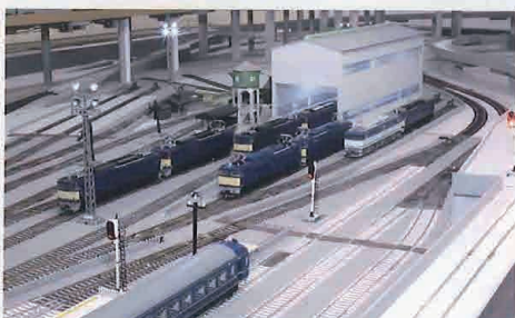
▲横川機関区を模した機関区は勾配線内回りに付属する施設。

利用は完全会員制となっており目下会員募集中とのことで、見学も随時受付中。いずれも、同店ホームページから会員規約を確認の上、申込みという流れになるので、いずれにせよ詳細はホームページでご確認ください。